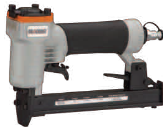
S-95 Deacero | Neumática Peso: 0.930 kgs