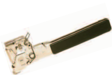
HT-550 | De golpe Peso: 0.900 kgs