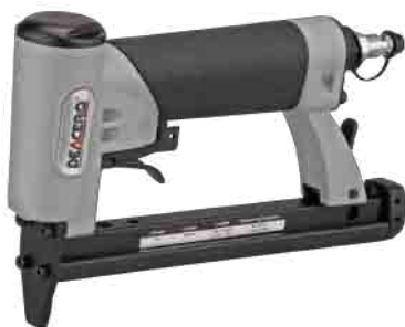
S-71 Deacero | Neumática Peso: 0.900 kgs